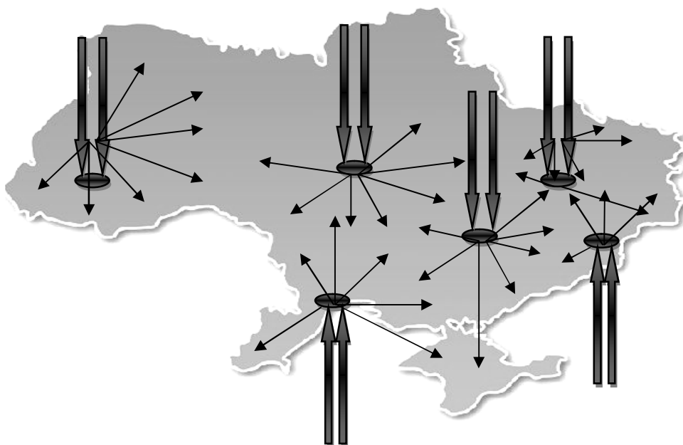
Рис. 3 Схема залучення інвестицій в найбільші міста України

успішне впровадження якої, надалі призведе до стратегії концентрації економічного потенціалу у найбільших українських містах (рис. 3).